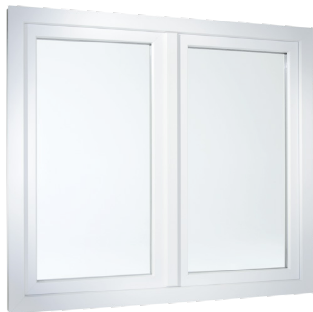
2-flügeliges Fenster in flächenversetzter Variante