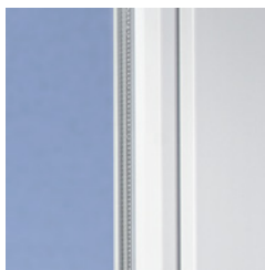
Klassisches Design mit weicher Kontur

Mit modernen Kunststofffenstern aus VEKA Profilen gewinnt jedes Haus. Denn das klassische Design des SOFTLINE Systems mit der leicht abgerundeten Kontur ist zeitlos und harmonisiert hervorragend mit unterschiedlichsten Architekturstilen – ob modern oder traditionell, ob Neubau oder Renovierung.